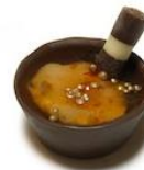
Cestinni de Pimenta