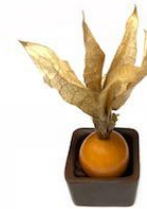
Caixeta de Physalis