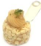
Limão Siciliano com Ampola de Limoncello