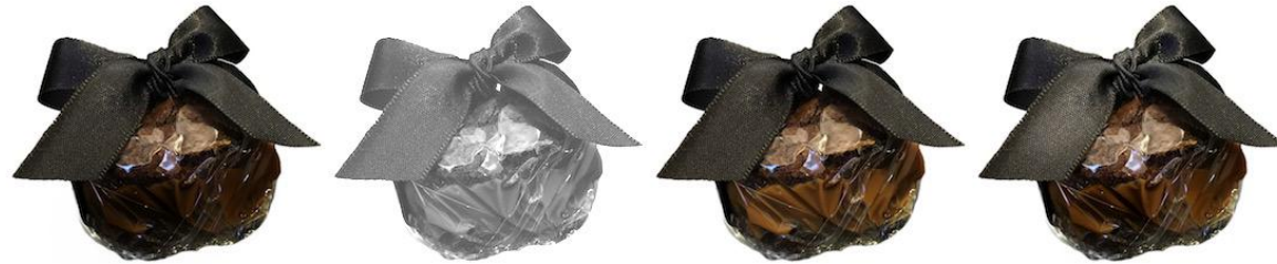
Brownie com Recheio de Brigadeiro

Brownie recheado? Bem-casado de Brownie? Não importa. Nossos Brownies irão surpreender você.