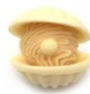
Ostra de Chocolate Branco