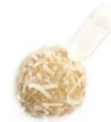
Ouriço de Coco com Ampola de Malibu