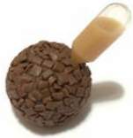
Brigadeiro Preto com Ampola de Amarula

Que tal a fusão entre doces maravilhosos e a sua bebida favorita em uma ampolinha? Sucesso garantido e aqui na Pretto Chocolates, o nosso clássico é a Ampola de amarula! Essa coleção é explosiva e inebriante. Puro êxtase!