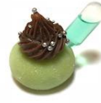
Menta com Chocolate e Ampola de Absinto