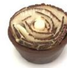
Cestinni Flor de Coco