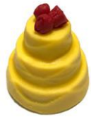
Bolinho de Chocolate