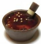
Cestinni de Frutas Vermelhas