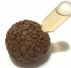
Brigadeiro Preto com Ampola de Whisky