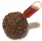
Brigadeiro Preto com Ampola de Vinho do Porto