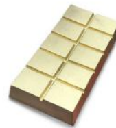
1KG Giant Barra com Doce de Leite