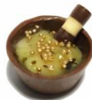
Cestinni de Menta