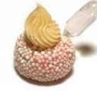
Docinho de Cereja com Ampola de Espumante