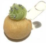
Espuma de Limão com Ampola de Gin