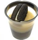
Petit Verre Oreo