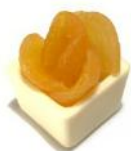
Flor de Damasco