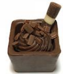
Caixeta de Brigadeiro