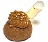
Docinho de Churros com Ampola de Tequila